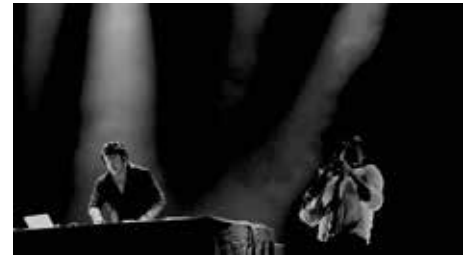
DJ + SAXOPHONE