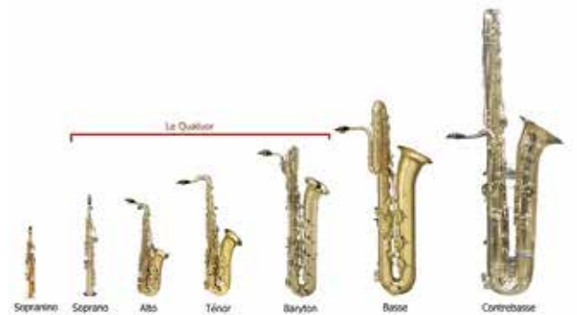
La famille du Saxophone.