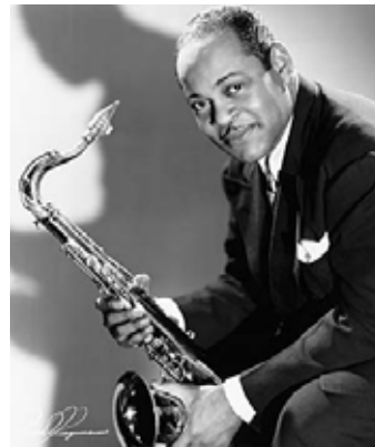
COLEMAN HAWKINS (1904-1969)

Le saxophone fait donc son apparition aux tous débuts du jazz, et c'est dans ce style qu'il va enfin exprimer sa vitalité.