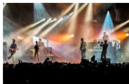
PAROV STELAR ET SON GROUPE EN LIVE

Dans un registre beaucoup moins classique on retrouve des groupes comme GOLDFISH, qui mélange ce style "jazzy" avec un style venant du jeu vidéo - 8-bit. Ils vont utiliser la contrebasse, le saxophone mais aussi le piano en plus de synthétiseurs, sampleurs etc.